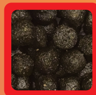
L粒 約 7 mm