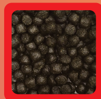
S粒 約 3 mm